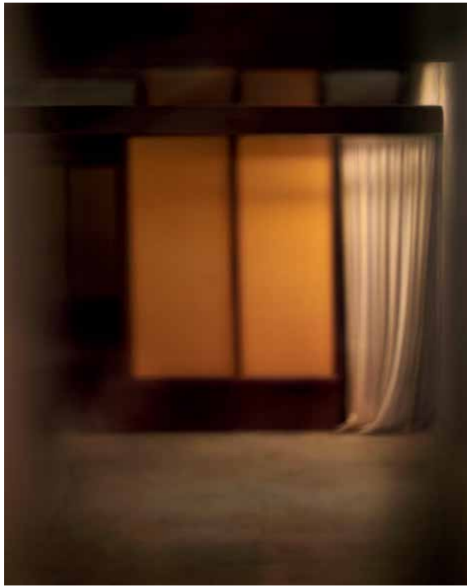
阿特利尔 (ATELIER), 选自《国王之路》©MonaKuhn