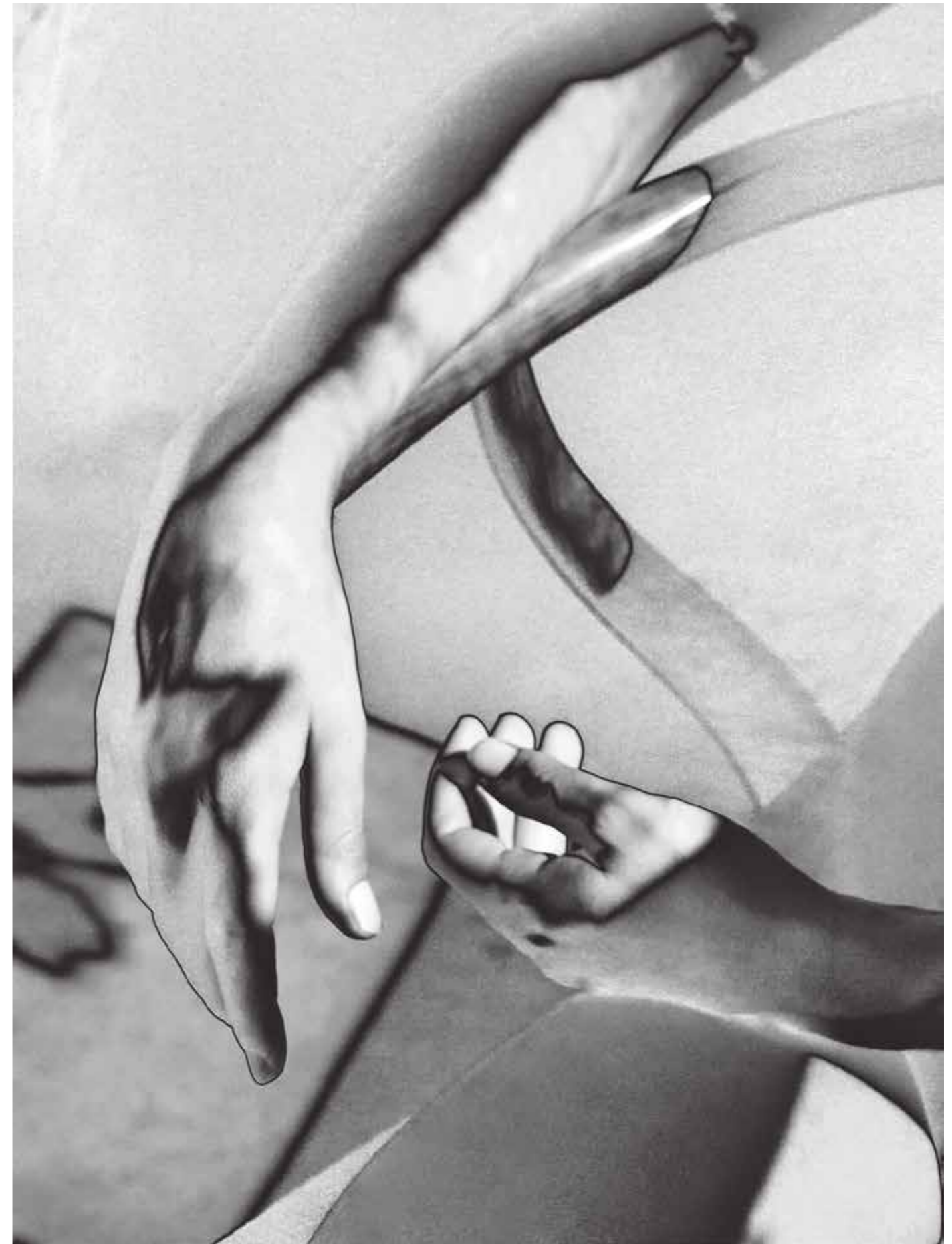
手势 (GESTURE), 选自《国王之路》©MonaKuhn

莫娜·库恩：我目前在工作室里很开心，同时创作三个完全不同的新系列，每个系列都在推动我的想象力和技能向前发展。我的朋友们说，正是这种不安分的天性推动我这些年来不断前进。