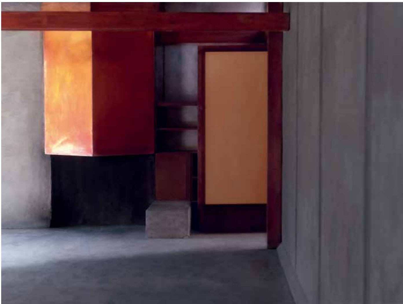
基本面 (FUNDAMENTALS), 选自《国王之路》©MonaKuhn