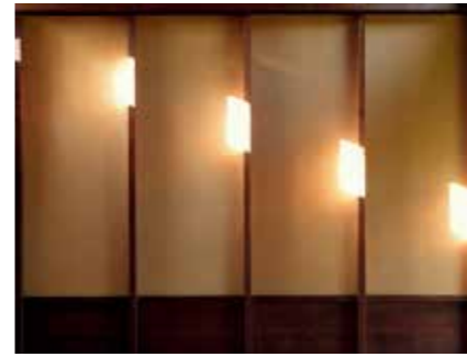
间隔 (INTERVALS), 选自《国王之路》©MonaKuhn