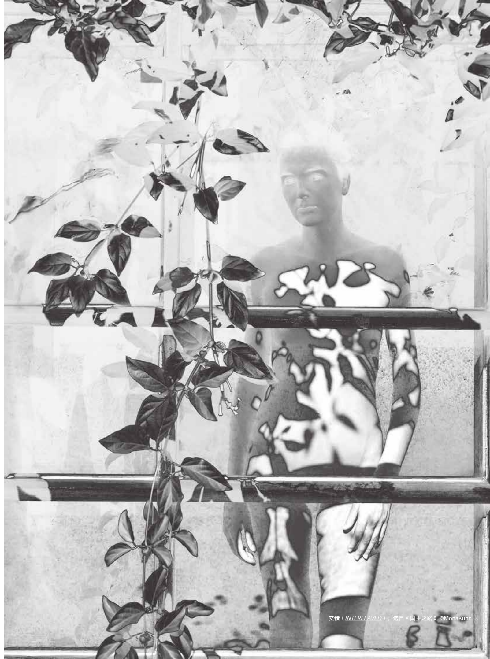
交错（INTERLEAVED），选自《国王之路》©MonaKuhn