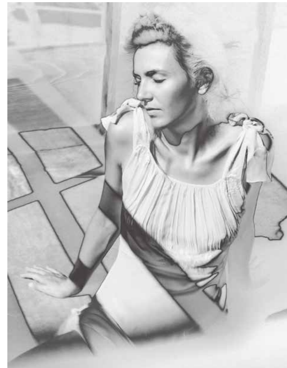
愉悦 (DELIGHT), 选自《国王之路》©MonaKuhn

莫娜·库恩：《国王之路》系列作品是从我第一次踏进奥地利建筑师鲁道夫·辛德勒 (Rudolph Schindler) 于1922年在洛杉矶建造的一座房子开始的。这座房子是一次社会和设计实验，也是知识分子的前卫中心。这座房子受到了亚洲建筑学的强烈影响，被认为是美国中世纪现代主义的第一个典范。一进门，我便开始研究这位建筑师，查阅他的建筑档案、当时的历史和文化背景、私人信件，直到我发现了这位建筑师写给一位神秘女士的情书。信是建筑师手写的，并有他的签名，但信中并没有写这位女士的名字。某种意义上，这封情书成为了我故事和作品的起点。接下来，我将这个神秘的女人（某位化身成辛德勒情人的模特）带入了这座房子。当这位女士在房子中穿行时，她的存在与房子本身裸露的结构融为一体。这位女性的身影时而出现在房子里，时而消失在房子外，与房子本身融为一体。我的意图是创造出稍纵即逝的图像，质疑摄影作为记录的本质。通过使用日晒这种实验性的暗房摄影技术，我将再现性进一步推向了形而上的领域。这种虚无缥缈的工艺在这座房子建成时首次被应用在超现实主义摄影中，以日晒明胶银版画技术，使图像部分非物质化。