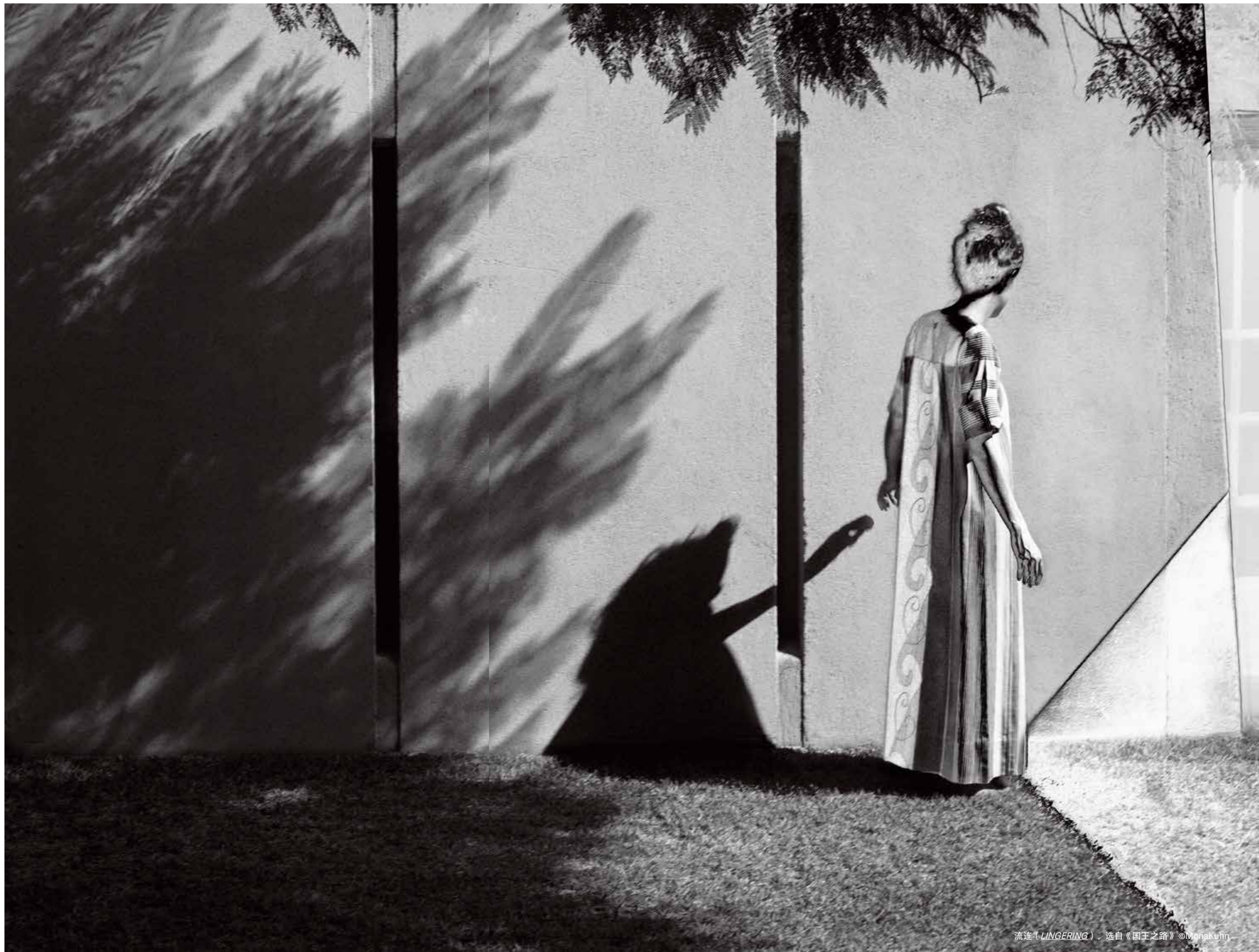
流连 (LINGERING) · 选自《国王之路》©MonaKuhn