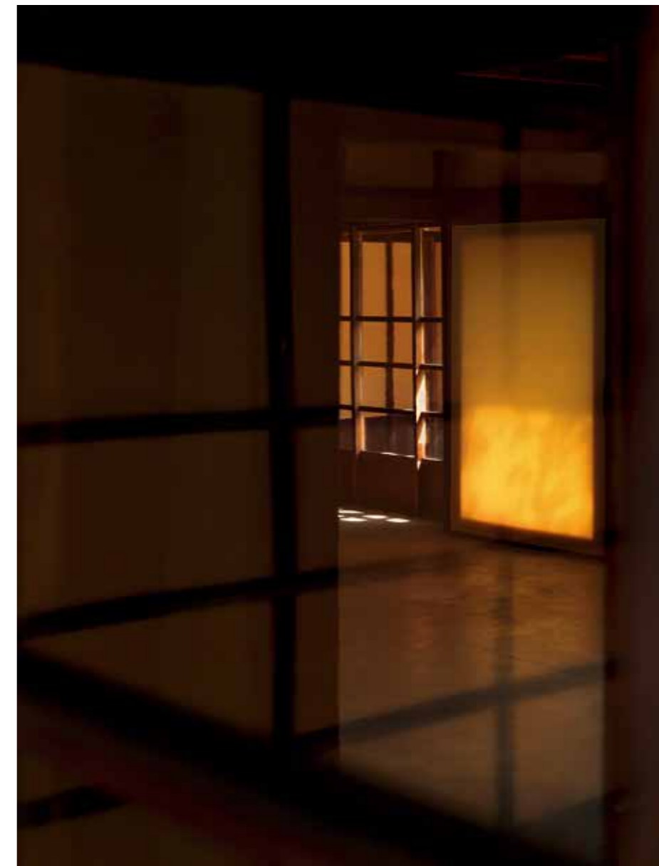
脉冲 (PULSE), 选自《国王之路》

莫娜·库恩：首先，我会拍摄认识的人或地方。为此，我必须事先对拍摄对象进行研究，或者已经认识对方一段时间了，一旦确定了这一点，就自然而然地营造出了一种有利的氛围。拍摄《国王之路》系列的时候我只用到了自然光，通过一年四季的观察和拍摄，捕捉更多的细微差别。而日晒版画则是我采用的一种实验性模拟暗房技术，目的是创造一种主体跨越时空的错觉，因为部分图像是按照预期呈现的，而不可预知的银晕区域则变得非物质化，就像氧化银的素描。