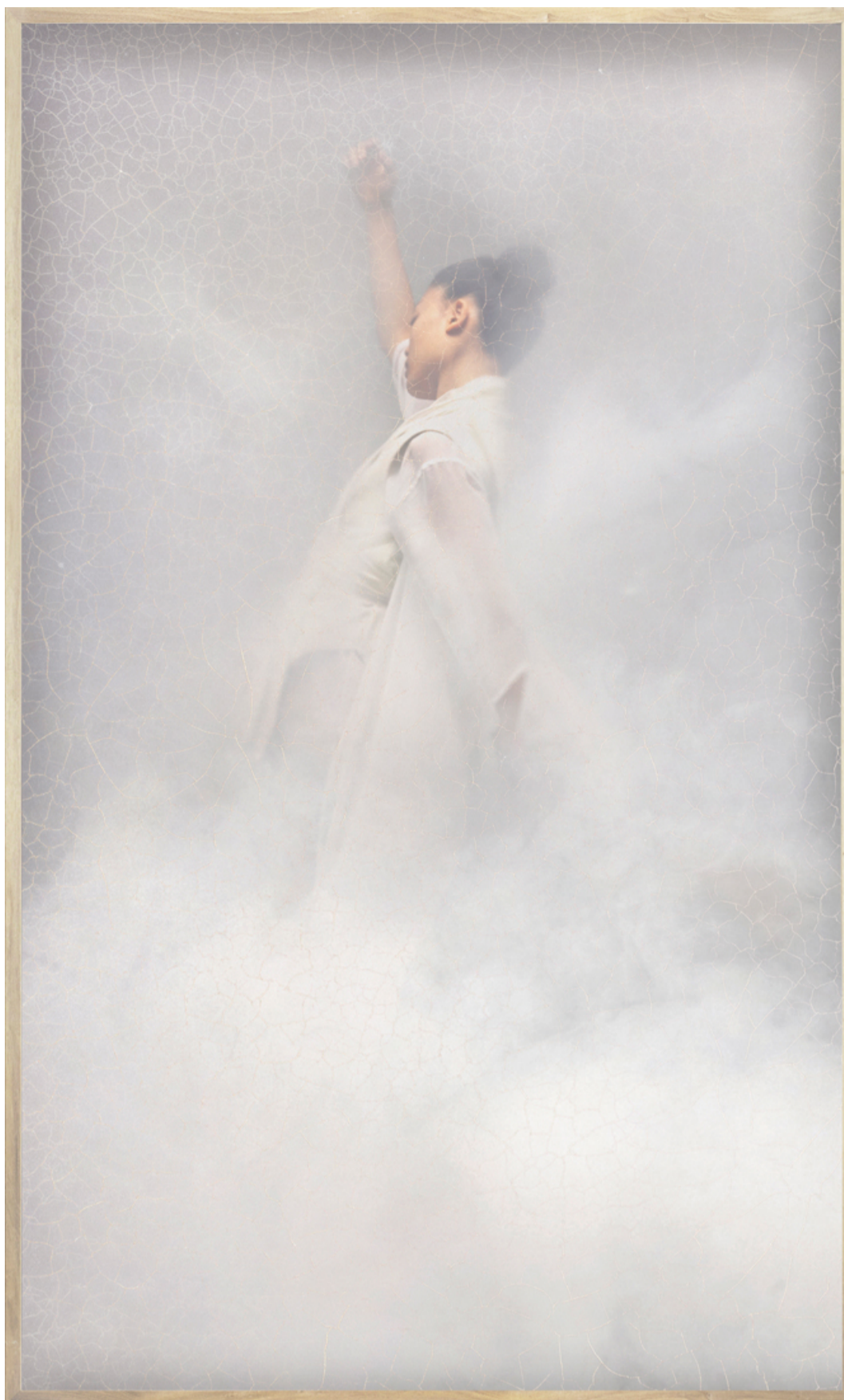
Madoka Void I 2023 Movement © Casper Faassen

In de geest van een cineast was René Groebli (*1927, CH) gefascineerd door de aard van beweging en de energie die in het i schuilt. Zijn werk 'The Eye of Love', geschoten tijdens zijn huwelijksreis in Parijs aan het begin van de jaren 50, werd aanvanke begrepen en geïnterpreteerd als een hommage aan de vrije liefde. Niemand zag in dat hier een fotograaf de vrijheid had genor medium te heroverwegen, om een verhaal met energie te vertellen en het te dynamiseren qua vorm en in houd.